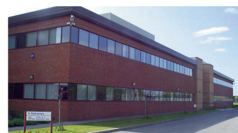
研究所(英国ファーサイド市)