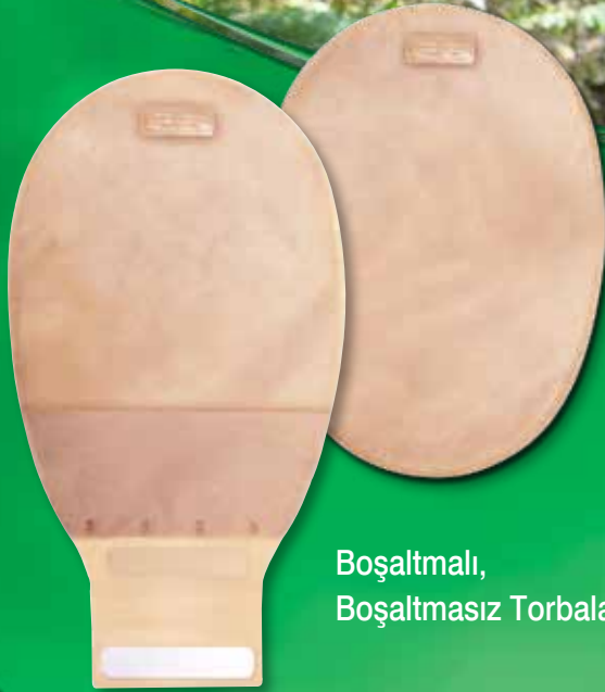
Boşaltmalı, Boşaltmasız Torbalar