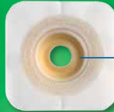
ConvaTec Moldable Technology™ Elle Şekil Verilen Adaptör