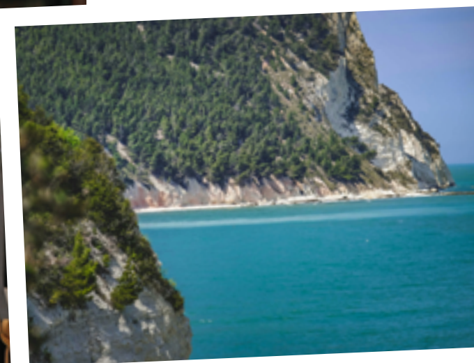
CONERO Il conero con le sue spiagge e il mare cristallino