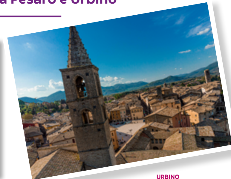
URBINO Città UNESCO e patria di Raffaello