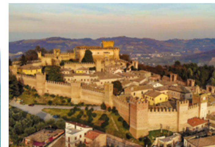
GRADARA Il meraviglioso castello di Paolo e Francesca