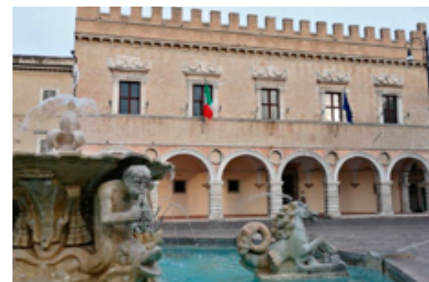
PESARO La capitale della cultura del 2024. La città di Rossini

Pesaro è stata proclamata Capitale italiana della cultura 2024. Un we lungo nella bellezza delle Marche tra Pesaro e Urbino