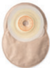
Esteem™+ Soft Convex uzavřený