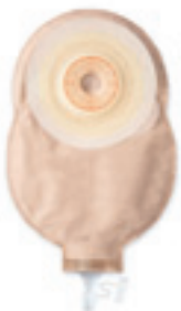
Esteem™+ Soft Convex urostomický