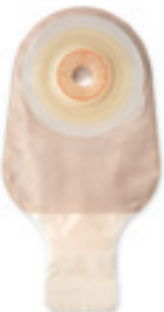
Esteem™+ Soft Convex výpustný