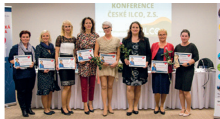
Finalistky ankety Moje stomická sestra