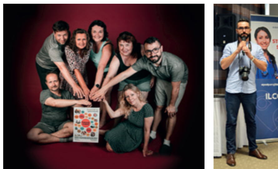
Realizační tým kalendáře Českého ILCO na rok 2022

Další významnou částí podzimní konference byl křest nového kalendáře Ano, my můžeme , který společně se stomiky nafotil mladý fotograf a zároveň zdravotník Michal Češek. Projektu se zúčastnilo 12 stomických pacientů, kteří si, podle jejich slov, focení velmi užili, protože probíhalo ve velmi příjemné atmosféře, která je brzy zbavila trémy. Výsledkem je krásný kalendář, kde jsou jednotliví stomici zachyceni se svými oblíbenými koníčky.