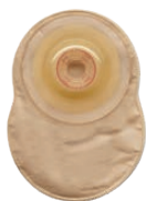
ESTEEM™ Flex CONVEX UZAVRETÉ VRECKO NEPRIEHLADNÉ S FILTROM