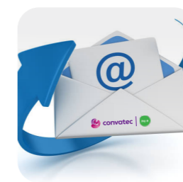
pravidelné zasielanie emailov

Naše pravidelne zasielané emaily vám dajú veľa tipov a rád týkajúcich sa životného štýlu, budete vedieť o novinkách v starostlivosti o stómiu a o produktoch. Môžete nás sledovať aj na sociálnych sieťach, kde sa veľa dozviete.