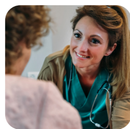
poradenstvo zdravotníckych pracovníkov

Keď potrebujete radu, podporu a istotu, sme tu pre vás. Môžete sa zúčastniť prezenčných prednášok a stretnutí alebo zavolať našim špecialistkám v zákazníckom centre, ktoré sú ochotné vždy poradiť.