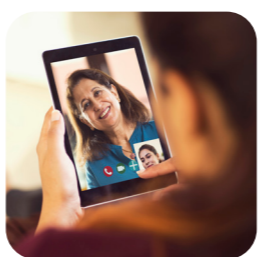
edukačné videá na rôzne témy