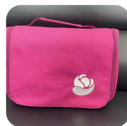
zadarmo taštička s propagačnými materiálmi a drobnosťami na starostlivosť o stómiu

Domov z nemocnice odídete so stomickými pomôckami na 1 mesiac. Nebudete tak musieť hneď prvé dni po prepustení riešiť ich dostupnosť. Počas celého vášho života so stómiou tu budú pre vás špecialistky v zákazníckom centre. Môžete s nimi hovoriť o produktoch, starostlivosti o stómiu, aktivitách bežného života. Ak nebudú vedieť zodpovedať vaše otázky, tak vás nasmerujú na odborníkov vo vašom regióne. V prípade záujmu vám pošlú bezplatne vzorky našich produktov na vyskúšanie. Budete tiež dostávať bezplatný časopis Radim, ktorý je plný užitočných tipov a rád na život so stómiou.