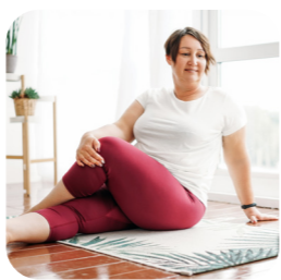
program me+ recovery súbor cvikov pre rýchlejšiu rekonvalescenciu