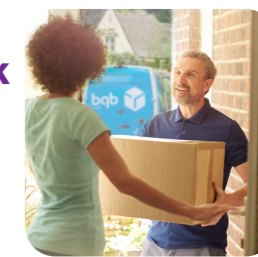
spoľahlivé doručenie pomôcok až k vám domov

Naša diskrétna doručovacia služba vám prinesie všetky stomické pomôcky, ktoré potrebujete, priamo k vašim dverám. Vieme, aké sú pre vás dôležité, a preto naše bezplatné, rýchle a spoľahlivé doručenie znamená, že sa nebudete musieť obávať, že ich nebudete mať k dispozícii.