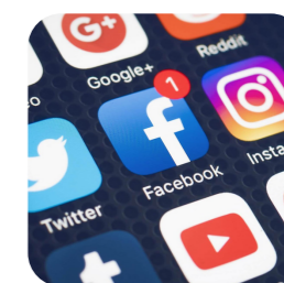
skvelé spojenie pomocou sociálnych sietí