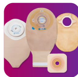
odborné poradenstvo o produktoch a bezplatné vzorky