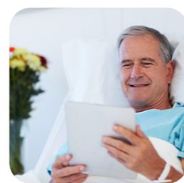
využitie tabletov v nemocniciach na edukáciu